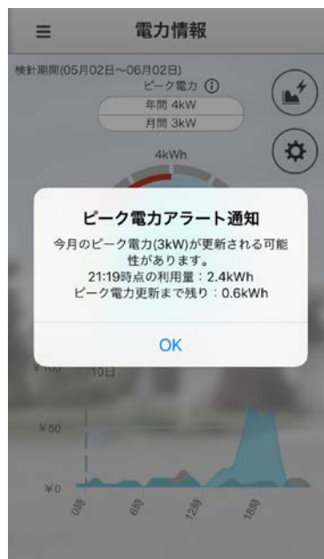
ピーク電力 アラート通知