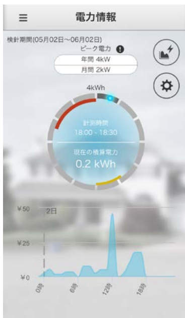
30分ごとの 電気使用量