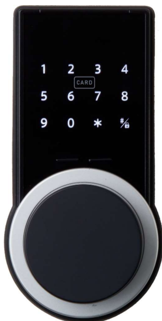
Glamo Smart Lock for LTE-M

『Glamo Smart Lock for LTE-M』は LTE-M(Cat.M1)通信機能を搭載した日本で初めてのスマートロックとなります。