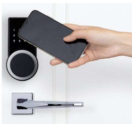
Glamo Smart Lock for LTE-M